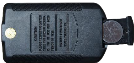
3V纽扣电池 (正极朝背面)